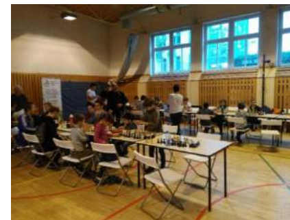
Bylo téměř plno